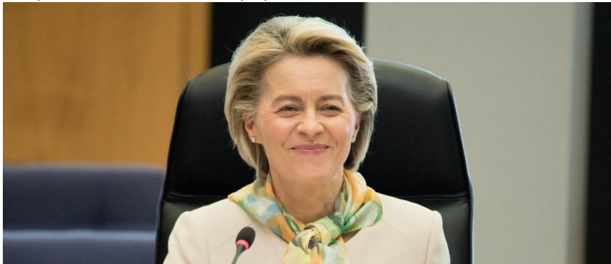
EU Commission president Ursula von der Leyen.

After US President Joe Biden kicked off with a renewed commitment to international cooperation in science and technology, the European Commission rehashes proposal to form transatlantic tech alliance to counterbalance the rise of China